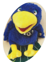
Kiri Der Kinderrechte-reporter und Unterstützer der Kinderredaktion