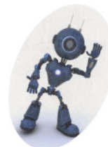
KI Die Künstliche Intelligenz unterstützt die Redaktion